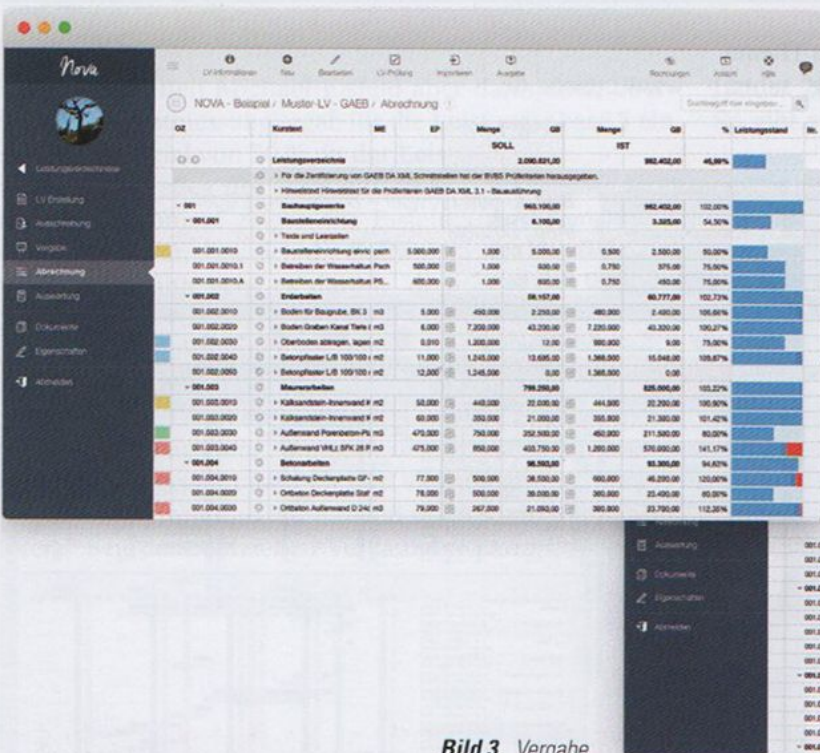
Bild 3. Vergabe

Der vielleicht größte Gewinn ist die Mobilität. Gerade in der Baubranche, wo eben nicht alles am Schreibtisch erledigt werden kann, ist es äußerst nützlich, wenn man Dokumente, Unterlagen, Notizen – eben alle Projektdaten – ohne großen Aufwand überall mit hinnehmen und von überall aus bearbeiten kann. Beim Bauherren die Kostenschätzung präsentieren, den Preisspiegel mit Kollegen auswerten, auf der Baustelle den Baufortschritt über Aufmaße dokumentieren und Nachträge steuern, als Vorgesetzter eine Beauftragung oder Rechnungsfreigabe durchführen – all das ist leicht möglich.